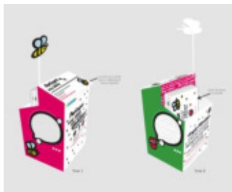
Quartier Durable Logis-Floréal à Watermael-Boitsfort – 2013

http://illegalart.org/projects/suggestion-box/