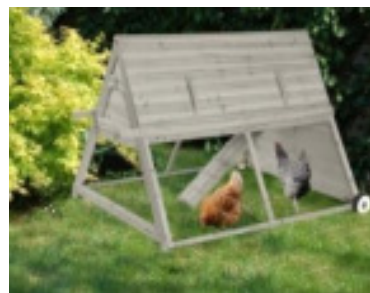
Figure 3 : poulailler mobile