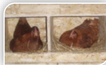
Les poules aiment pondre dans un endroit où elles se sentent comme dans un cocon

Ces petits compartiments, carrés de 30 cm de côté, sont destinés à la pondaison (et à la couvaison lorsqu'il y a présence d'un coq). On compte en moyenne 1 pondoir pour 2 poules, puis 1 pondoir pour 3 poules supplémentaires. En effet, Les poules ne pondent pas en même temps mais à tour de rôle.