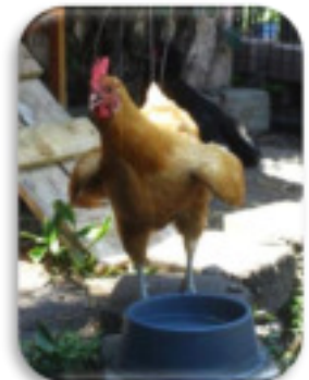
Bec ouvert, ailes écartées : cette poule a chaud!

Les mots-clé pour l'été sont : eau propre, aération et ombre.