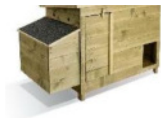
Figure 1 : poulailler sans enclos intégré Figure 2 : poulailler avec enclos intégré

Attention, pour éviter qu'elles ne volent au-dessus de la clôture, il est nécessaire que le grillage ou le mur de l'enclos fasse 1,20m, 1,50 m de haut.