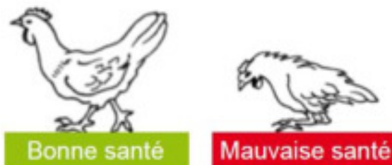
Illustration issue du carnet du SIVOM dont la référence se trouve à la page 15.

Observez régulièrement vos poules et n'hésitez pas à agir si vous observez des signes suspects dans leur comportement tels que : démarche curieuse, inertie, plumes gonflées, plumes qui tombent, crêtes pâles/ tombantes, diarrhée, perte d'appétit, oeil gonflé, arrêt ou baisse de la ponte, etc.