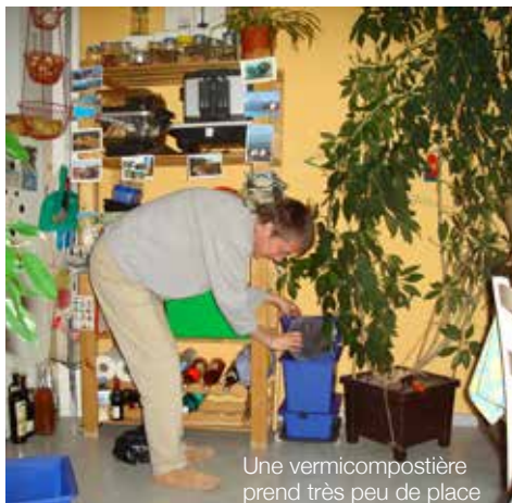
Une vermicompostière prend très peu de place

Infos : www.environnement.brussels/compost