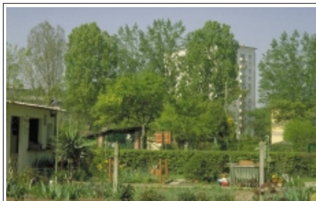
I.W.-J.de F. - Transition verte entre jardins et immeubles d'habitation : un bel exemple d'intégration à Strasbourg

L'arbre joue donc un rôle important pour l'intégration paysagère des jardins familiaux dans leur environnement, en articulant esthétique et fonctionnalité.