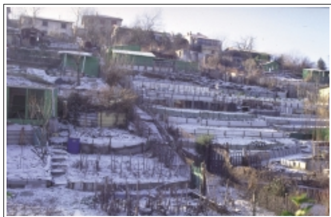
CAUE 69 - Jardins Volpette à St Etienne : éléments structurant le paysage bien lisibles en période hivernale

Il n'y a pas un modèle du «beau» jardin...; si chaque jardin exprime la sensibilité, les besoins et l'ingéniosité du jardinier, alors chaque parcelle aura une esthétique séduisante et culturelle .