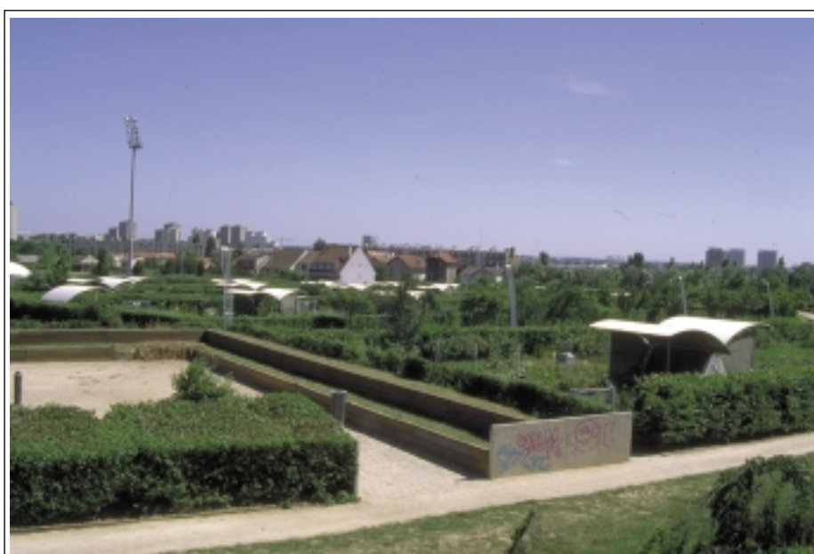
ECB-LFCTF - Architecture pour abris de Jardins Familiaux à Villejuif (Ile de France) dans le parc départemental «des Hautes Bruyères» (Renzo Piano, architecte)

Pour nous, parler « d'appropriation » et de paysage c'est évoquer des regards et des ressentis, du vu et du vécu.