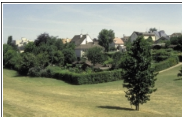
ECB-LFCTF - Haies et arbres permettent l'appropriation et l'intégration paysagère du groupe de jardins avec l'espace public dans lequel il est implanté.

Les plantations d'arbres et de haies permettent une meilleure évolution du jardin nouvellement créé ou réaménagé, évolution nécessaire à l'appropriation du site par ses protagonistes. L'arbre recouvre plusieurs fonctionnalités : élément de relief vertical structurant l'intérieur du groupe (rôle d'espace tampon, marquage de limites) avec l'environnement extérieur en assurant une transition entre urbanisme minéral et jardins, fonction d'embellissement, rôle rafraîchissant de son ombrage, production fruitière ou matière à tuteur et compost (feuillage d'automne).