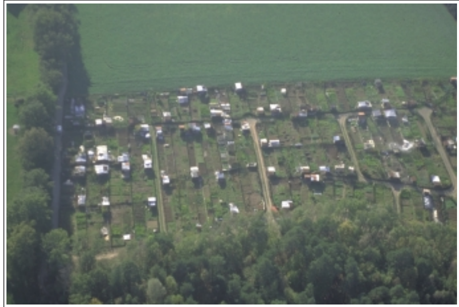
JDA - Image d'un groupe de jardins, paysage de village

Chaque parcelle de jardin familial est une œuvre originale créée à partir d'éléments communs à tous : un lopin de terre, très souvent un petit abri, une treille, un châssis, une grosse part de cultures vivrières et souvent un coin bouquetier. Le tout est délimité par une clôture protectrice ou une simple marque d'intimité.