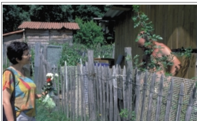
JDA - La clôture : élément propice aux palabres et à l'intimité.

Mais le plaisir du jardinage est également celui du créateur, façonneur du vivant et de la nature où chacun, selon l'art de la débrouille et de l'expérience, va constituer son propre Eden. Le rapport à la terre devient alors sensuel à travers la caresse du vent frais ou du soleil de printemps. Ces plaisirs plus solitaires et intimes remettent les corps et les esprits en harmonie avec les rythmes naturels. Ils permettent d'atteindre des vertus faites de béatitudes, de méditations et de spiritualités reconnues depuis longtemps dans le jardin .