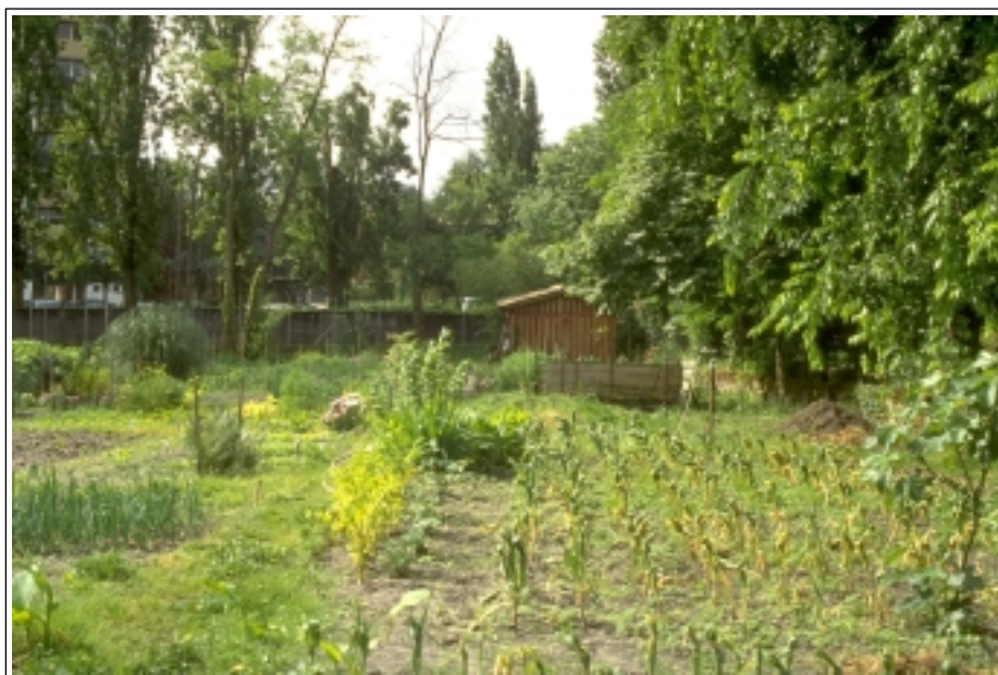
JDA - Les arbres permettent une transition douce des jardins dans un contexte urbain, ... des espaces de «respiration» ... (centre-ville de Bordeaux)

Les jardins sont donc à la fois des lieux privés, mais aussi publics.