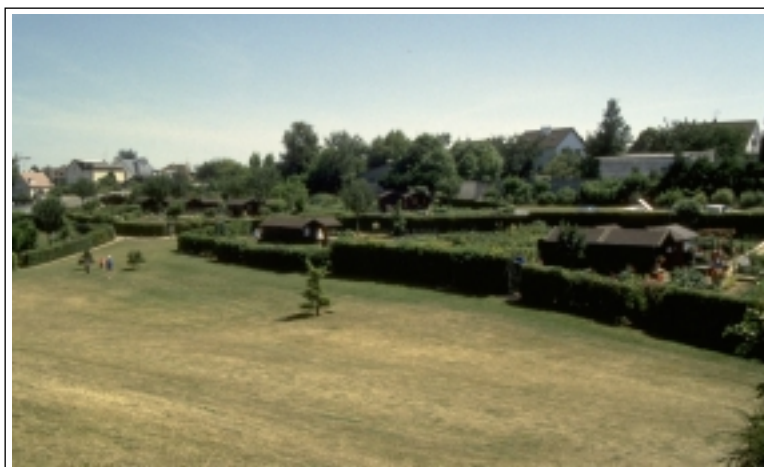
ECB-LFCTF - Les abris peints de couleur foncée, se fondent dans le paysage.

La couleur est donc une solution simple : complémentarité des teintes, ou harmonie, soulignant les couleurs dominantes de l'environnement immédiat (couleur des immeubles de proximité, etc.).