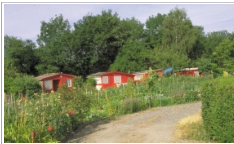
ECB-LFCTF - Un bel exemple réussi : harmonisation collective, tout en conservant la créativité individuelle (Ecully, près de Lyon).

La couleur a aussi une place importante dans l'appréhension du groupe de jardins. Pour exemple, sur un site ancien de Jardins Familiaux à Ecully (près de Lyon) on a délibérément décidé de repeindre en rouge vif les cabanons hétéroclites. Loin de choquer, cette couleur vive et inattendue se marie au vert dominant des feuillages.