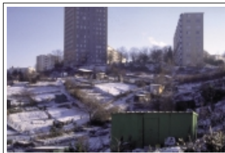
CAUE 69 : jardins Volpette à St Etienne : le jeu des volumes et des rythmes dans le paysage des jardins lorsque toute verdure a disparu, et que «Dame Nature» ne se prête plus au camouflage