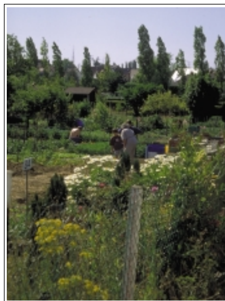
ECB-LFCTF - "... les allées invitent à la promenade..." (J.F. Normandie).

Les rationalistes "purs et durs" prétendront que les courbes favorisent les délaissés d'espace que les jardiniers ne pourront pas efficacement exploiter. C'est faux. Les délaissés sont très rapidement utilisés pour implanter un bosquet de noisetiers (pour les noisettes, les tuteurs, un abri pour les oiseaux) ou un massif de fleurs.