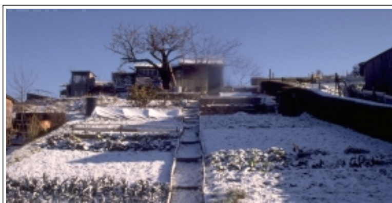
CAUE 69 - "La fonction première des chemins est la distribution des accès aux parcelles de jardins,..." (jardins Volpette à St-Etienne)

Leur fonction première est, certes la distribution des accès aux parcelles de jardins. Mais à la croisée des chemins, on se dit bonjour, on cause des petits services de voisinage. Dans ces sites de nature, les allées invitent à la promenade. Les promeneurs recherchent le bucolique et apprécient de flâner au gré des parfums de l'été ou du printemps. Le bucolique inspire la marche .