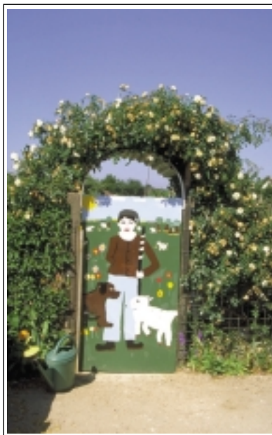
ECB-LFCTF - Portillon d'accès personnalisé d'un jardin à Caen

Les éléments de relief naturel et autres lignes structurantes (talus, haies, cheminements, allées, places, bosquets) permettent de donner la transition entre les jardins et leur environnement, et une cohésion à l'ensemble du groupe de jardins.